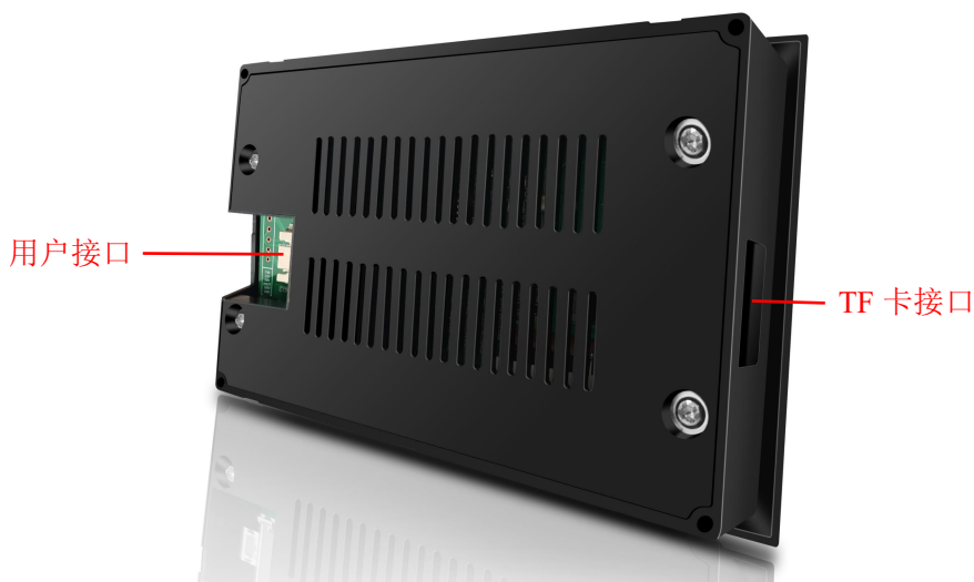
图 1 产品外观及硬件配置图